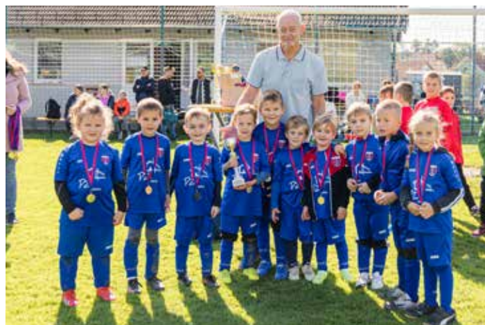
Jugendturnier in Schrick mit 170 Teilnehmern