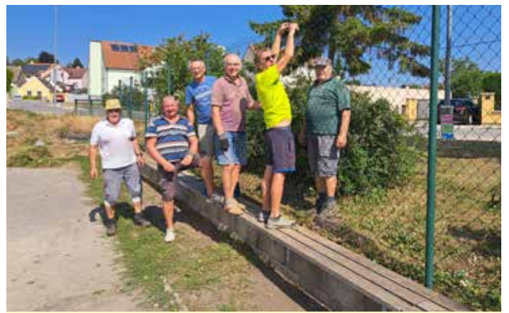
Erneuerung des Zaunes beim Spielplatz Johannesgasse