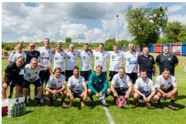
COPA Pele-Mannschaft zu Gast in Schrick