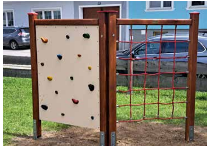
Neue Kletterwand beim Spielplatz Johannesgasse