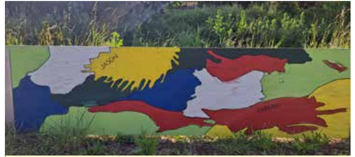
Kindergartenkinder dekorieren Bandenbegrenzung