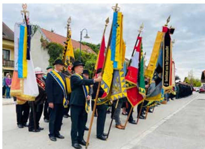
Kranzniederlegung beim Kriegerdenkmal