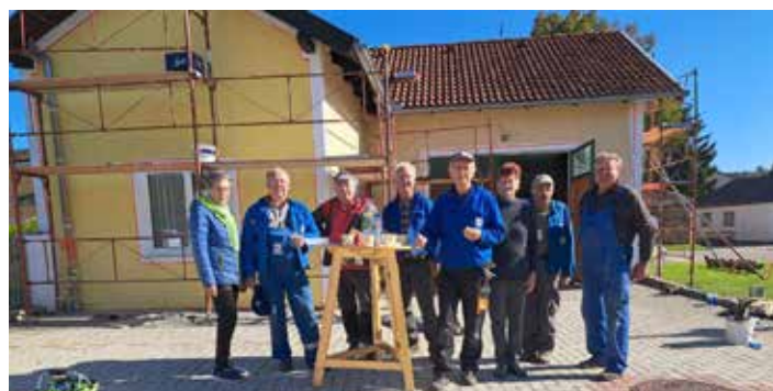
Fassadenenerneuerung beim Vereinsdepot