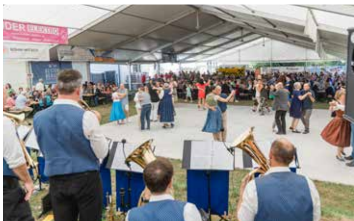
Tolle Stimmung beim Kirtag im Musikerheimgarten