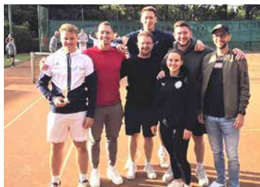
5-Orte-Turnier in Bad Pira- warth