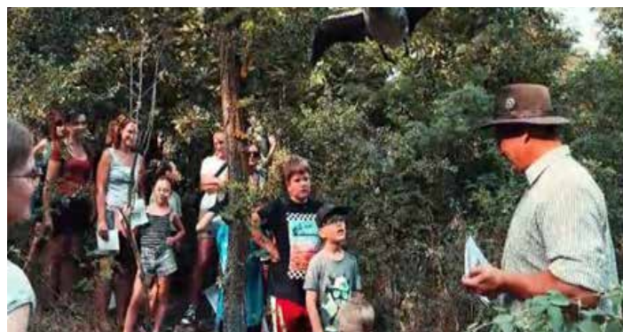
Ferienspiel - Wildtierkunde mit erfahrenen Jägern

Ich wünsche allen meinen Kunden ein frohes und besinnliches Weihnachtsfest und viel Freude und Erfolg im Neuen Jahr