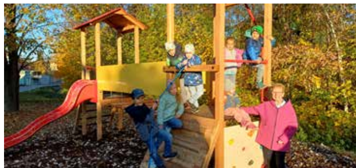
Neues Spielgerät beim Spielplatz Brunnenweg