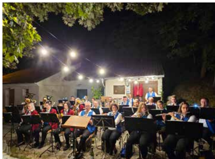
Dämmereschoppen im Schricker Holitsch

Bereits Mai starteten wir unsere Vorbereitung für die Marschmusikbewertung die heuer in Gaweinstal abgehalten wurde. Gemeinsam