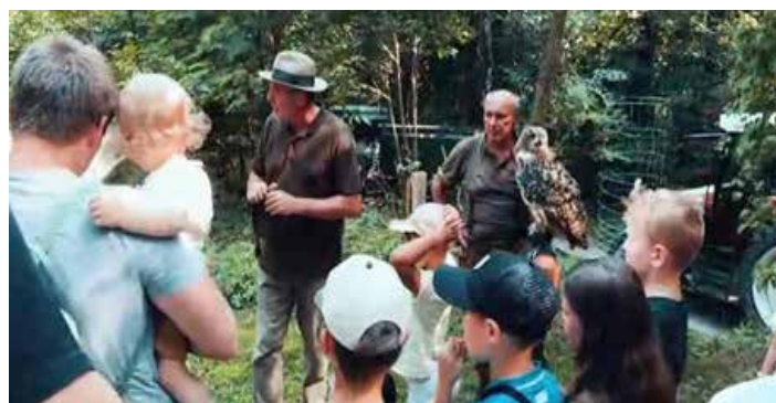
Ferienspiel - Greifvögel hautnah erleben