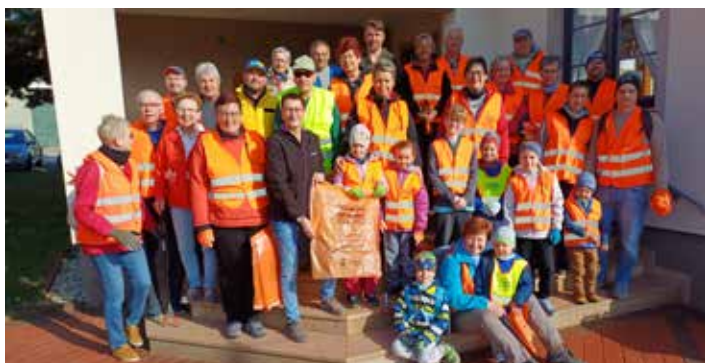
Am 5. April fand der schon zur Tradition gewordene Müllsammeltag der Gemeinde statt. Erfreulicherweise waren unter den 30 Sammlerinnen und Sammlern auch viele Kinder dabei - herzlichen Dank allen Teilnehmern.