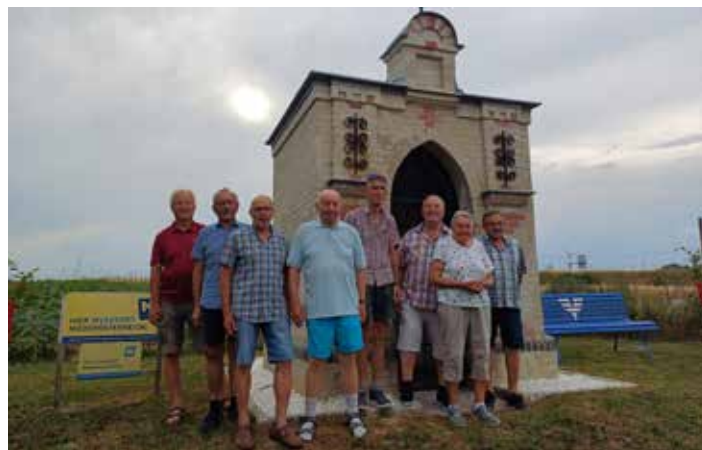
Wetterandacht bei der Krauthügelkapelle

Die Mitglieder des ÖKB-Schrick wünschen Ihnen und ihren Familien Gesundheit, Erfolg und viel Glück im neuen Jahr.